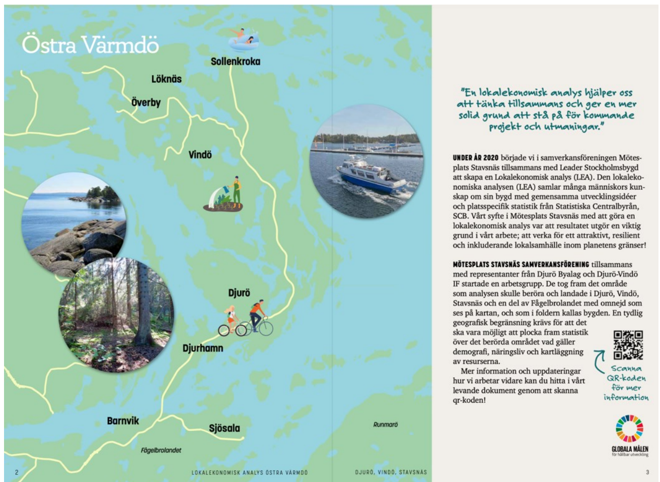
Bild från Göran Ehrson och Per Lejonekes presentation, ett utdrag ur Östra Värmdös LEA